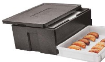
Contenitore isotermico per pasticceria Insulated pastry box Konditorei-Thermobehälter Conteneur isotherme à pâtisserie Contenedor isotérmico