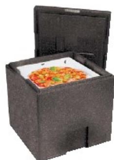
Box trasporto pizza, isotermico Insulated pizza box Pizza Thermobehälter Conteneur isotherme à pizza Contenedor isotérmico para pizza