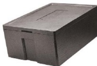
Contenitore isotermico UNIVERSAL Insulated container Thermobehälter Conteneur isotherme Contenedor isotérmico