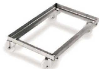
Carrello inox Dolly, stainless steel Transportwagen Edelstahl Rostfrei Chariot inox Carro inox

Per teglie da 60x40 cm. Può essere chiuso o aperto anche quando è impilato. - For trays 60x40 cm. Easy to open and close also when stacked.