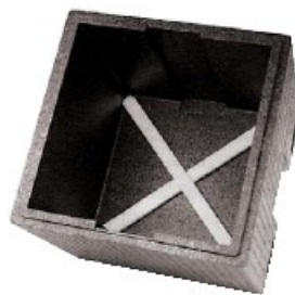
Insero croce polipropilene Cross PP Scheider, PP Séparateur, PP Separador en cruz, PP

Trasporta scatole pizza max. 35x35 cm. It carries pizza boxes of max 35x35 cm.