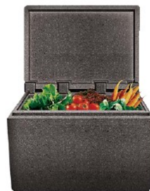
Cargo-Box, isotermico Cargo-Box, insulated Cargo-Box Thermobehälter Conteneur isotherme Cargo-Box isotérmico

Ideale per proteggere le scatole pizza dall'umidità. - Specific to protect pizza boxes from humidity.