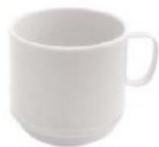
Tazza isotermica, PC Isothermic coffee cup Isolierkaffeetasse Tasse isotherme Taza isotérmica