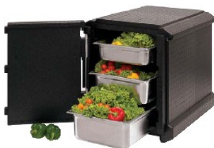
Contenitore isotermico GN 1/1 Insulated box GN 1/1 GN 1/1 Thermobehälter Conteneur isotherme GN 1/1 Contenedor isotérmico GN 1/1

Per teglie o contenitori 60x40 cm. For sheets or containers 60x40 cm.