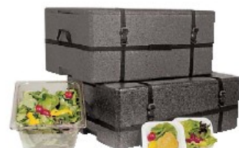
Imbragatura elastica Resilient sling Gummi-Schleppgurt Elingue élastique Cinta elástica

Per GN 1/1 o sottomultipli. For GN 1/1 or submultiples.