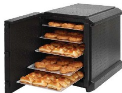
Contenitore isotermico Maxi Insulated box Thermobehälter Conteneur isotherme Contenedor isotérmico

Per GN 1/1 o sottomultipli. For GN 1/1 or submultiples.